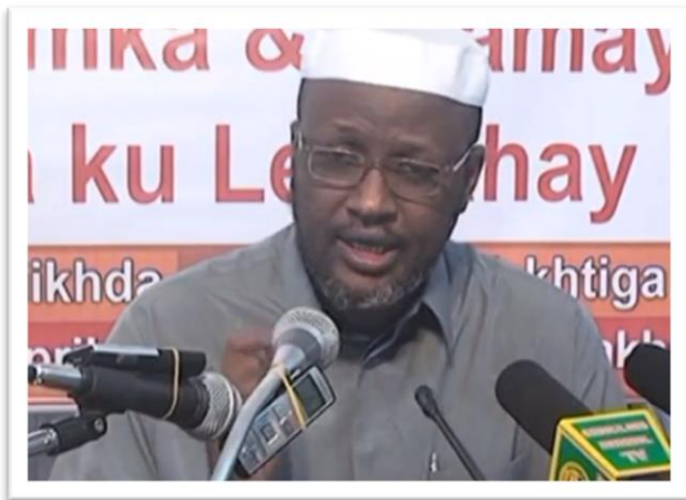
Sheikh Xasan Cabdisalaan