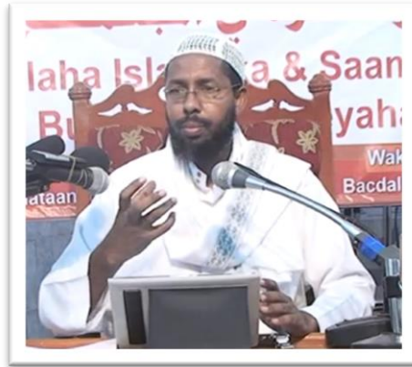
Sheikh Cabdiqani Xussen