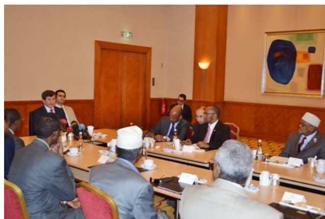
Weftigii Somaliland iyo Soomaaliya, oo uu u dhexeeyo Raysal Wasaarihii Turkiga. Istanbul.

Kulamadii shirarkii wada hadalladu way badnaayeen. Waxaa lagu kulmay UK, Imaaraadka, Turkey, Jabuuti iyo Kenya (oo Informal ahaa). Waxaa la isla gartay arrimo muhiim ah, oo ay ka mid ahayd in loo wada hadlo si siman (Somaliland-Soomaaliya); In la iska kaashado nabadgelyada; In si siman loo qaybsado maamulka iyo dhaqaalaha hawada, Hargeysana laga maamulo; In wixii hadalxumo ah ee dhaawici kara wada hadallada la joojiyo; In wixii